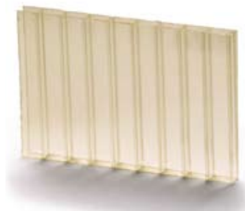
Примерок 3: \Delta Y_i = 10 - Гаранција за обична повеќеслојна PC плоча