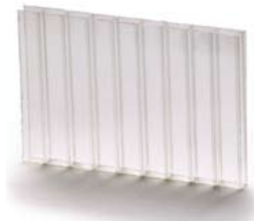
Примерок 1: \Delta Y_i = 0 - референтен примерок

* Trademarks of General Electric Company.