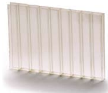
Примерок 2: \Delta Y_i = 2 - Гаранција за плочи Thermoclear Plus